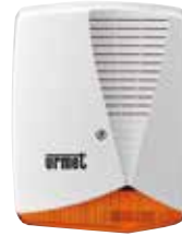
SIRENA ESTERNA AUTOALIMENTATA CON LAMPEGGIANTE cod. 1033/414